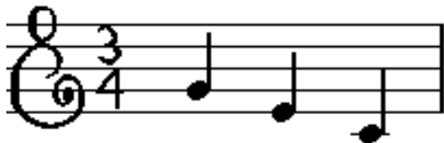
Auff dem Papier.

Schwanzlin für die Noten : wo dasselbe von oben kömmt / hebet der Accent Ton einen höher an / bey unserm gegenwärtigen Beyspiel kãm solch Signum von unten ; Es wird gedachter Herr Bach öffters von denen Collegiis Musicis critiziret / ursach die Manieren er allezeit genau für zuschreiben pflege / es ist denen Musicanten heunt zutage allein üblicher Weis ein mehrer Freyheit hierinnen verstattet / daher wir alle Manieren über die Noten allhie appliciren / darmit der Musicante selbst sie / nach seinem Gefallen darhinnen könne setzen. Wie der gönstige Leser siehet / habe allhier einen Punct an unser Bälcklein angefüget / wo dasselbe oben daran erschiene / erfolgete der Überschlag von dem höhern Tone : Mehrentheils bedarff es solchermassen Punctes nit / weillen die Accents allezeit angewendtt werden / je nachdem die Meloden auff oder absteigende ; wo die Tönen nehmlich absteigen / werden gleichwol die Accents von oben herab appliciret / und werden die Terz Durchgãng darbey Transiti geheissen.