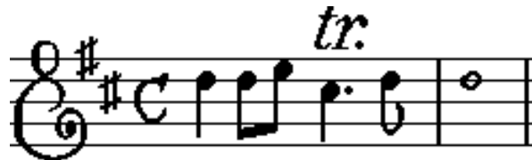
Beispiel vor eine Cadence.

Ein Trillo muß stets behend als gar scharff geschlagen werden / massen sonst er nicht recht brilliren wird / und ist besser / lieber keinen zu schlagen / dan ein ganz und gar lahmicht Manier ; In einer Cadence ist er allein hochnöhtig / und ist üblich / bey dem Beschlusse einen Triller zu schlagen : In erfolgendem Exempel wird die Secunda minor davor gebrauchet / bestehende in denen Tönen \text{D} und \text{C}\# / massen D-Dur nach der Dominante A-Dur außweichende / da \text{C}\# Tertia major .